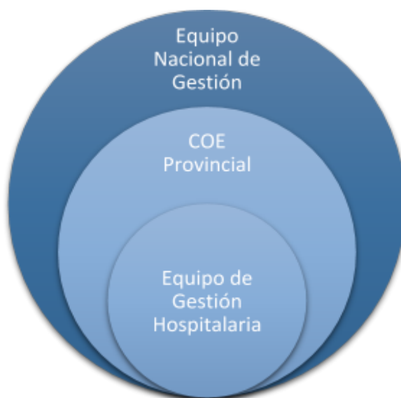
Gráfico 1: Organización Coordinada